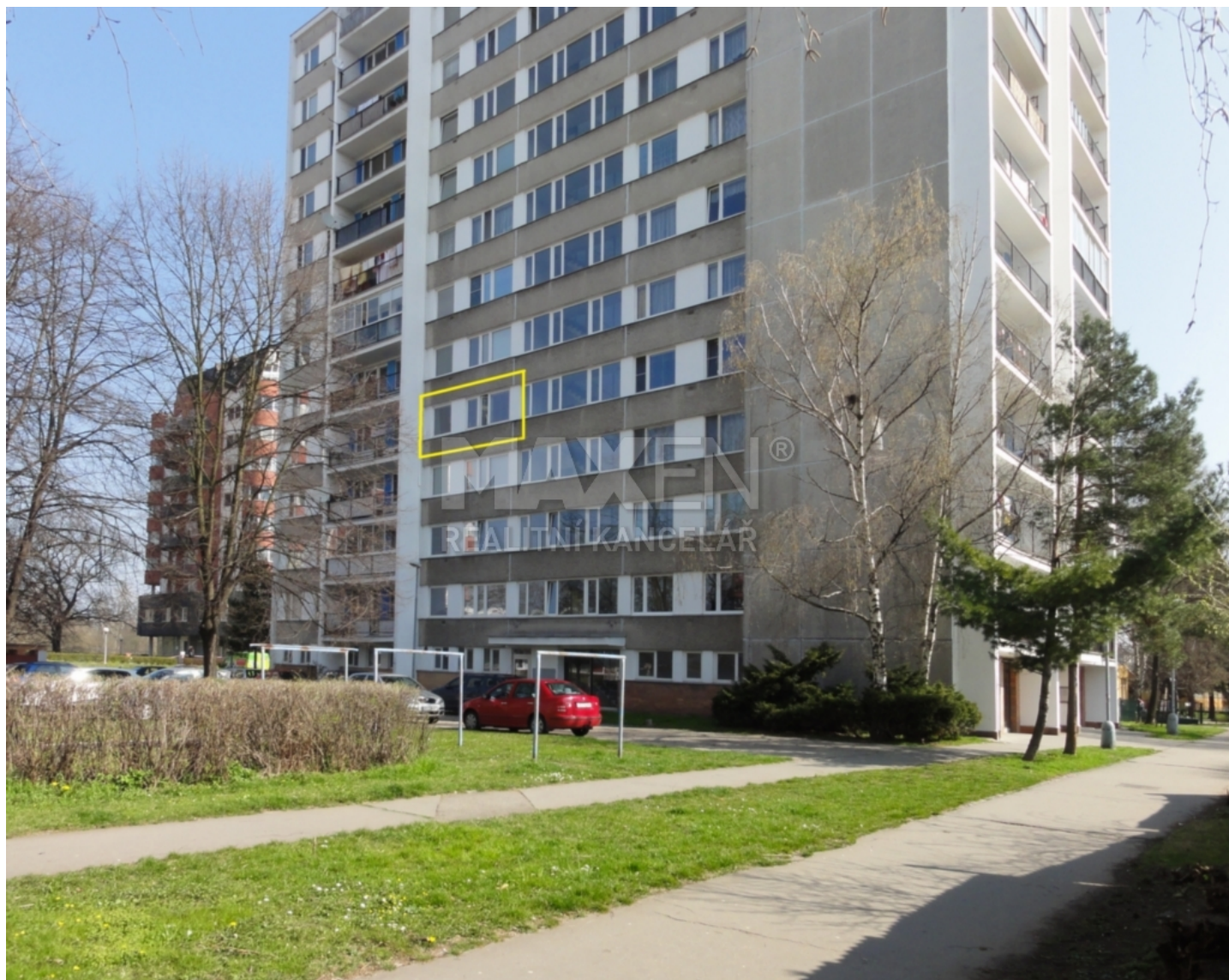
BYT 1+1 40 m 2 (S VLASTNÍ LODŽIÍ NA CHODBĚ, S VLASTNÍ KOMOROU NA CHODBĚ)