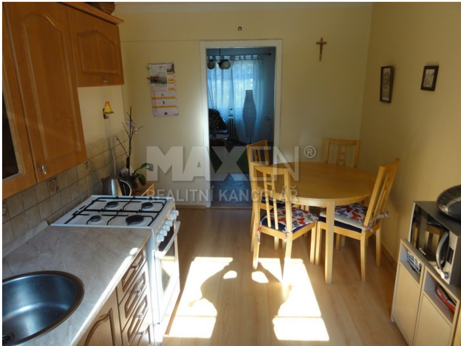
Cihlový byt 2+1 + komora, 60 m 2 (+ 2x sklep)